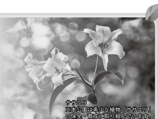
ササユリ ※本公園は希少な植物「ササユリ」の保全・育成に取り組んでいます。

備北公園管理センター ☎ 0824-72-7000 (http://www.bihoku-park.go.jp/)