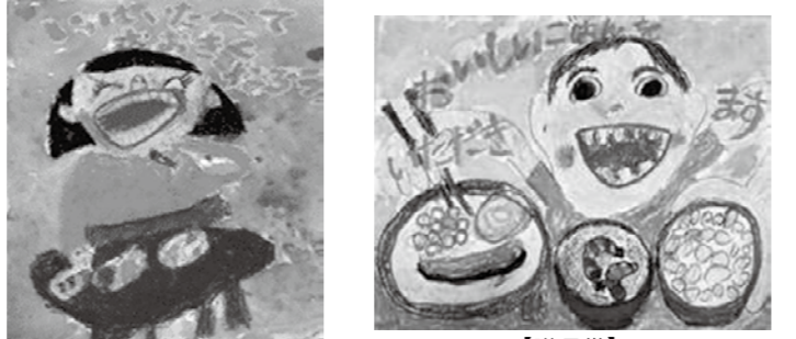
【市長賞】 滝本 美羽(庄原小1年) 【議長賞】 森永 正義(庄原小1年)

受賞作品 11月18日、カラダ・ココロすこやかフェスタ会場で表彰式を行いました！