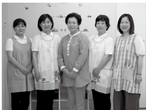
わらべ保育室の皆さん

わらべ保育室では、病気のお子さんや保護者の皆さんに安心して利用していただくため、児童の年齢や症状に応じ