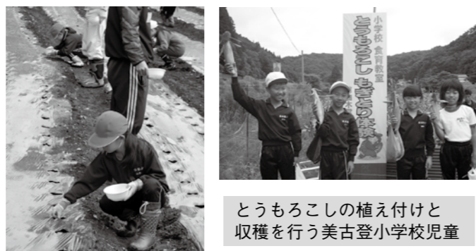
とうもろこしの植え付けと収穫を行う美古登小学校児童

庄原市食農教育モデル事業は、地域の農業や、食の安全などへの関心・理解を深めるために、市内の小中学校を対象として、地域の子どもたちに「食」と「農業」の大切さを学習する機会を提供する取り組みを支援しています。