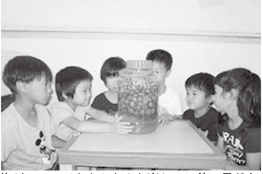
梅ジュースできたかな？と楽しみに待つ子どもたち

七塚保育所では、春は山菜採り、夏は野菜の収穫、秋は芋掘りや稲刈りと、子どもたちは四季を通じて、さまざまな活動の中で自然と食のつながりを体験しています。 稲作や菜園活動では、苗植えから収穫までを観察・体験することで作物には命があることを学び、筍掘りやフキ採りなどでは、自然の恵みを見つけたり食べたりすることの喜びを経験しています。力いっぱい五感を働かせ、身近な食材に出会うことで、旬の味や香り・食感に気づき、食への関心を高めています。 今年は保育所の2本の梅の木に、たわわに梅の実が実りました。子どもたちは木登りや踏み台を利用して、高い枝に手を伸ばし、一生懸命に梅の実を採りました。採った実は水にさらし、あくを抜いた後、子どもたちがようじを使って一つずつへたを取り除き、表面に無数の穴を開けて氷砂糖に漬けました。廊下に置いた瓶の中で日に日に氷砂糖が溶け始め梅のジュースがたまっていくさまを毎日楽しみに観察しました。「お水がたまってきたよ」「梅が茶色くなってきたよ」「早くジュースが飲みたいな」「まだ？」待つこと約1カ月。梅の実がしわしわになり氷砂糖がすっかり溶けて飲み頃を迎えました。冷やした水で割った梅ジュース。ちょっぴりすっぱいけれど、さわやかな梅の香りに包まれた初夏の味を堪能しました。