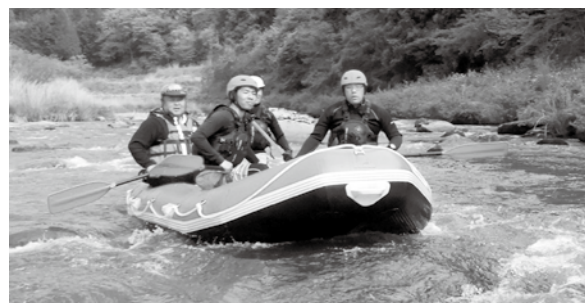
ラフティングの様子

西城川から眺める庄原の美しい田園風景や、皆で力を合わせてボートを操船しながら激流を乗り越える体験は、大変貴重なものです。初心者でも大歓迎ですので、ぜひご参加ください。 とき ①9月9日(日) 13時～16時30分 ②9月21日(金) 13時～16時30分 ③9月30日(日) 13時～16時30分 ※受付開始12時30分 ※河川の水量により中止となる場合があります。 集合場所 鮎の里公園 対象 市内にお住まいの方(※中学生以上) ※妊娠中や傷病中の方はご遠慮ください。 募集人数・参加費 1回につき20人・1人につき2千円 持参物 着替え・タオル・飲料(※ヘルメット・ライフジャケット・ウェットスーツ・リバーシューズは用意しています) その他 爪は事前に切っておいてください。眼鏡を使用する場合は、落下防止用ひもをご準備ください。