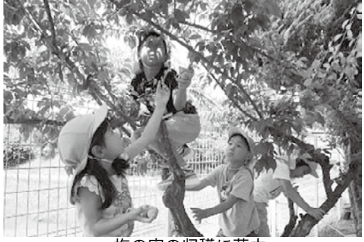
梅の実の収穫に夢中