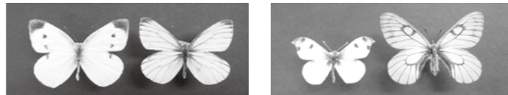
左からモンシロチョウ、スジグロシロチョウ、ツマキチョウ、ウスバシロチョウ

今年は暖かくなるのが早かったのでチョウも早くから飛びまわっています。翅を広げた大きさが3センチメートル程度の小さいチョウで、「白いチョウを見ればモンシロチョウ！」といませんか？今回は白いチョウについて調べてみましょう。