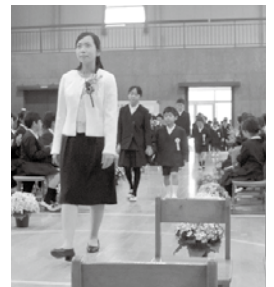
教諭に続いて6年生に手を引かれて入場