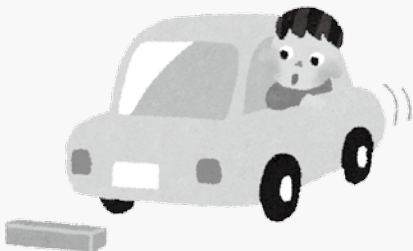
●市内の交通事故発生状況（5月末時点）