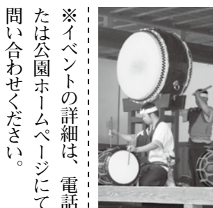
和太鼓フェスティバル

●森の感謝祭 「森の榮校」ボランティアによって整備された森の中で、お花見やワークショップを開催します。 4月15日(土) 10時～15時 (観覧無料・体験有料) ゆるゆるの森 南臨時駐車場 ●FLOWER ワークショップ 春の花にちなんださまざまなワークショップを開催します。開催日によって内容が異なります。詳しくはホームページをご覧ください。 4月29日(土・祝)、4月30日(日)、5月3日(水・祝) 7日(日)の10時～16時 参加費 有料(内容によって異なります。)