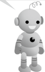
工業統計キャラクター コウちゃん