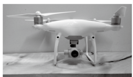
中央にカメラを搭載したドローン

市は3月16日から庄原市自然とやすらぎの里宿泊研修施設「かさべるで」と比和総合運動公園で「ドローン操縦技術講習会」を開催し、市民および市内の事業所に勤務する24人が受講しました。 この講習会は、市内でドローンの操縦に長けた人材を育成するために、市が平成28年度に国の交付金を活用して取り組んでいる「ドローン活用事業」の一環として開催したものです。講師は、講習会の運営を委託したNECフィールディング株式会社のインストラクターが務め、最初の2日間でドローンに関する法律やルール、構造などを学んだ後、3日間の操縦技能訓練で飛行技術の習得を目指しました。 受講生は、安全にドローンを飛行させるために注意すべき点や守るべきルールを熱心に学び、操縦