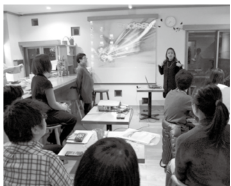
移住体験者と参加者で活発な意見が交わされた

3月4日に、東京都の恵比寿で、定住相談とPRを目的に「しょうばら里山スタイルin 恵比寿」を開催しました。 子育て世帯向けの昼の部では、1家族の参加でしたが、アットホームな雰囲気の中、子育て環境や生活環境など、庄原市への移住について具体的にさまざまな相談を受け、大変充実した時間となりました。 夫婦や単身者など大人のみを対象にした夜の部では、里山スタイル(庄原暮らしを楽しんでいるU・Iターナー)による庄原生活体験談、市職員による生活費シミュレーションの説明、後半は、本市出身の店長が営むお好み焼き店で、庄原直送の食材を堪能する交流会を行いました。参加者から「参考になりました」という声や「食材が素晴らしい」といった多くのご意見を聞くことができました。