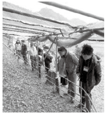
散策を楽しむ参加者