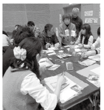
みんなで絵手紙を作成

2月26日、総領町の道の駅リフトア・ステーションをメイン会場に、縁結びイベント「恋風」を開催し、独身の男女24人(男女各12人)が参加しました。 里山を楽しむ町イベント実行委員会と共催したこのイベントは、初恋の香り風に誘われ春便り、というテーマで開催される節分草の自生地公開にあわせ企画。自己紹介ゲームを皮切りに、節分草自生地の散策や絵手紙の作成、レクリエーションなどを楽しみました。 最後のマッチングでは、カレーライスで判定。マッチングした人には辛いカレーが当たるとあって、参加者は恐る恐るも期待を胸にカレーを口に運びました。 結果、6組のカップルが誕生。平成28年度最終イベントが、最もカップリング率が高いイベントとなりました。 しょうばら縁結び事業は、本年度も継続して結婚を支援していきます。