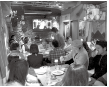
庄原直送の食材を味わいながら交流会

庄原市単独のイベントとして、交流会は昨年開催しましたが、相談会・セミナー形式は初めての試み。里山スタイルの体験談など、一歩踏み込んで庄原生活の実際をお伝えした部分が特に好評で、庄原市と参加者との新たな縁もできるなど、実りの多いイベントとなりました。 今後も首都圏など、地方移住に関心のある方が多い地域でPRを進めていきます。