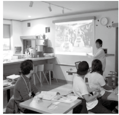
参加者は庄原市の紹介を熱心に聴いた