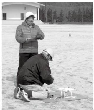
飛行準備を講師がチェック