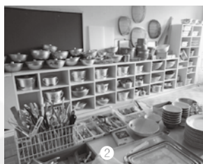
① 第2回旧帝釈小学校で開催したときの様子 ② 食器類 ③ ビーカール ④ 音楽太鼓 ⑤ 理科や計測器などさまざまな学校備品が並びます

庄原市内の廃校施設で長年使われていなかった学校備品を販売します。売り上げは全て、庄原市の将来を担う子どもたちの教育費として使います。 忘れられ捨てられるのではなく、新たに脚光を浴びることが出来る場所に送り届けたい。そんな想いから「廃校ノスタルジア in 庄原」は動きだしました。 今回は前回に引き続き旧帝釈小学校を会場とし、地元の方、市民団体、学生、行政が力を合わせて実施します。旧戸宇小学校・旧久代小学校などから、子どもたちの机・椅子、跳び箱、楽器や理