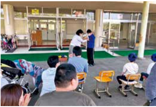
庄原特別支援学校での贈呈式

「人権の花」運動の一環として、4月10日～28日に、市内の小学校と庄原特別支援学校小学部へ花の種を贈呈しました。「人権の花」運動は、草花を育て、思いやり、いたわること、児童の道徳的な感情をより豊かなものにするとともに、人権を尊重する心を育てることを目的に、人権擁護委員と市が協力して、毎年取り組んでいます。本年度は、各学校の朝礼や下校前の時間に贈呈式を行いました。 贈呈式では、人権擁護委員が「人権の花」の目的を説明。その後、委員から花の種と肥料を贈呈しました。児童は「貰った花をみんなと協力して育てたい」と張り切っていました。