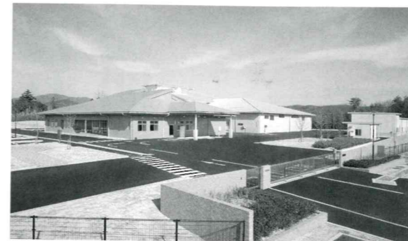
是松町にあるリサイクルプラザ

市では、4月からリサイクルプラザを稼働し、ごみの減量化やリサイクルを推進しています。また、地域の環境美化や生活環境の保全を目的に、「ポイ捨て等防止条例」を制定するなど、環境衛生の向上に向けて各種取り組みを推進しています。