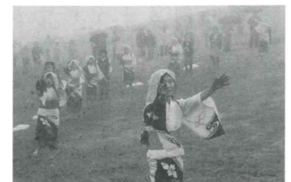
県民謡「比和音頭」「バイ流し」が披露され、参加者も一緒に踊りました

雨天のため、夏山登山の安全を祈願する神事式は休暇村本館にて行われましたが、屋外の会場では、広島牛の丸焼きなどバザーコーナーが立ち並び、餅まきなどでにぎわいました。