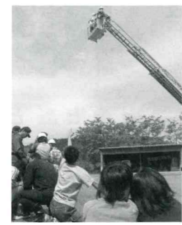
あつという間に高い所へ

庄原市消防団高野方面隊が5月29日(日)、上高公民館で少年消防クラブ・婦人防火クラブ合同訓練を行いました。