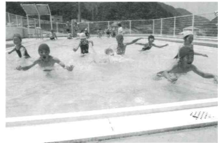
みんなで楽しく泳ぎました

最初はぎこちない動きだった児童たちでしたが、水の感触を確かめて慣れてくると大はしゃぎ。パタ足など基本的なことから、友だち同士で水をかけあい歓声を上げる姿も見られ、学年ごとに楽しい時間となりました。