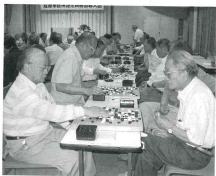
碁盤上で繰り広げられる「白」と「黒」の戦い