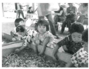
浴衣で祭りを楽しむ子どもたち

当日は、聖慈保育園、みどり園保育所の園児による歌や踊り、手品ショーやシャボン玉遊びなど、浴衣を着た子どもたちは大はしゃぎ。また、会場には屋台やゲームコーナー、おもちゃ屋が並び、大人も一緒に祭りを楽しみました。