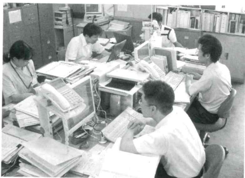
ノーネクタイで業務にあたる職員

市役所本庁および各支所、また公共施設などでは、6月13日から「ノーネクタイ運動」を実施しています。