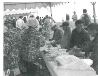
多くの方でにぎわったバザー

吾妻山は四季折々の高山植物や山野草が咲き乱れ、また、晴天時には山頂から日本海や大山(鳥取県大山町)も望めます。吾妻山でゆっくりとやすらぎの時間をお過ごしください。(休暇村 吾妻山 ☎0824-85-2331)