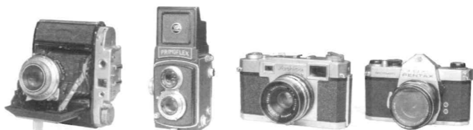
スプリングカメラ 2眼レフカメラ 距離計連動カメラ 1眼レフカメラ (35ミリカメラ)