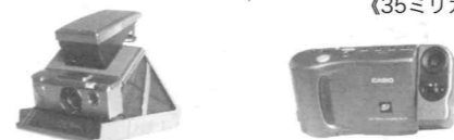
インスタントカメラ 最初の家庭用デジタルカメラ