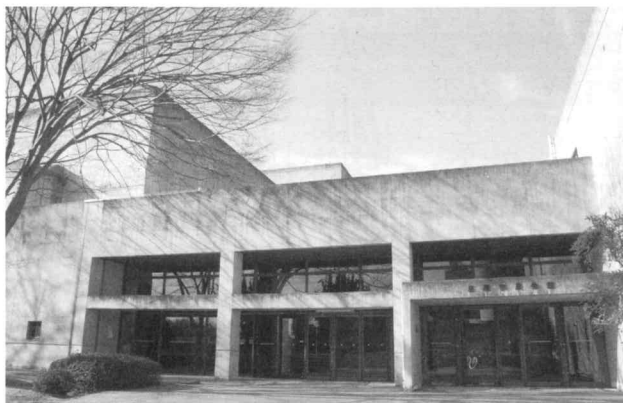
指定管理となった市民会館

4月から、市民会館、上谷コミュニティセンターの2施設が指定管理者による管理となりました。また、すでに指定管理となっている本村自治振興センターが、旧本小学校に移転しました。 指定管理者制度は、多様化する住民ニーズに、より効果的・効率的に対応するため、「公の施設」の管理に民間の能力を活用しながら、住民サービスの向上と、経費の節減などを図ることを目的としています。現在、市内の186施設へ指定管理を導入しています。