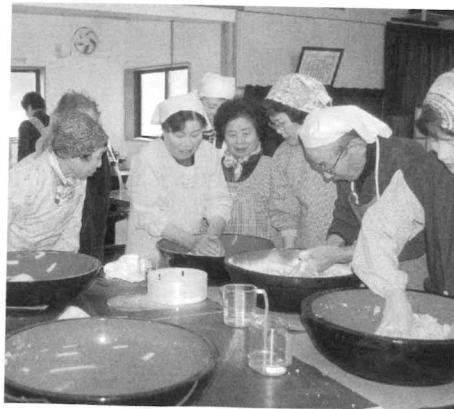
西城・八鳥自治振興区が活動促進補助金で拠点整備を行い、そば教室を開催

1の育成を図るため、自治振興区活動など地域づくり活動を実践している方の研修などに補助金を交付します。 ●補助金 対象経費の3/4以内で、上限は5万円。 ●問い合わせ 自治振興課自治振興係(☎0824-73-1209)または各支所地域振興室