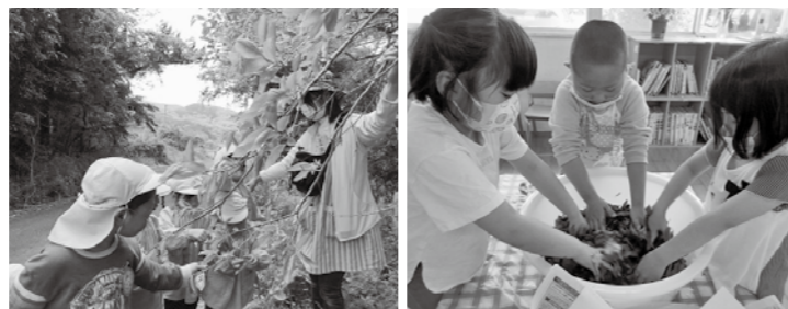
▲保育所周辺で材料探し ▲園児によるお茶づくり

採ってきた野草は、3歳～5歳の幼児組が、洗って、切って、揉んで、干して、種類ごとにお茶にしていきます。種類によって収穫の時期が違うので、同じ作業を繰り返します。大変な作業ですが、その経験から根気強くなり、目的を持って取り組むことを学んでいます。