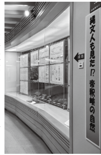
▲新しいテーマで展示を実施

当館は、国定公園帝釈峡に所在する現地型の総合博物館として、活動を行っています。新しい展示も行っていきますので、ぜひご来館ください。