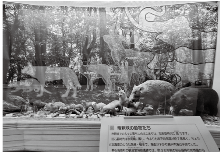
▲「帝釈峡の動物たち」

写真は、新しい展示の一つである「帝釈峡の動物たち」です。動物標本を生かし、縄文人が目にしたであろう照葉樹の森と動物たちの姿を、間近で見れるような展示にしています。旧石器時代から現代まで、約3万年間の帝釈峡の動物たちの移り変わりを体感できる内容になっています。