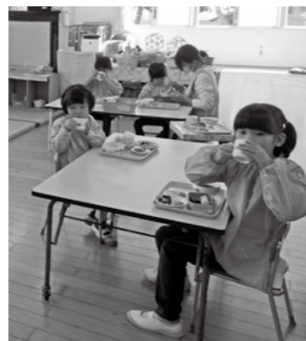
▲手作りの田森茶を飲む園児

田森保育所では、今後も田森茶づくりを通して、生まれ育った地域への愛着や、食を営む力の育成に取り組んでいきます。