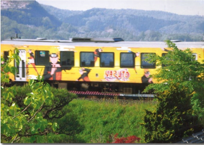
(平成 25 年 5 月 13 日撮影)

特別な列車を見たり、乗ったりするのも鉄道の大きな楽しみの一つ。 この特別列車の時刻表はインターネットで確認することができるので、狙って乗りに行くことができます。家族や友達と列車に揺られながら楽しい思い出をつくってみてはいかがでしょうか。