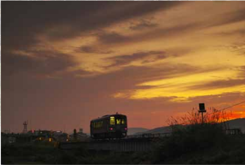
タイトル/茜色の街へお帰り 撮影日/平成 26 年 10 月 11 日