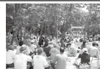
▲昨年のオープニングの様子

「山に親しむ、山を楽しむ、山に学ぶ」をテーマに「ひろしま「山の日」県民の集い」が開催されます。県内12市町で開催されるこの集いは今年で12回を数え、庄原市では「板橋さとやま学びの森」が会場となります。板橋小学校の「板橋一心太鼓」、広島のおやじバンド「モノトーンズ」によるライブ演奏のほか、里山の手入れ講座・ポニーに乗って遊ぼう・森のクラフト教室・自然観察会などのプログラムが用意され、飲食などが楽しめるテント村も開設されます。この自然豊かなフィールドに集い、森の持つ力を感じてください。※この集いの開催費用は、ひろしま森づくり県民税が活用されています。