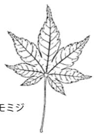
当館で作成した樹木検索表より

樹木の名前は葉でわかる 山に行ったとき、目の前にある樹木の正しい名前をあなたはいくつ言えるでしょうか? 林業や剪定の仕事をしている人や興味のある人でなければ、あまり知りませんよね。 しかし、そのような人でも簡単に樹木の名前を調べる方法があります。それは樹木の「葉」を使った検索の方法です。花や果実などでも調べることができますが、花や果実は期間が短く、いつでも調べることができません。葉の場合は、落葉樹であっても半年くらいは観賞でき、とても分かりやすいのです。 葉の検索は、「広葉樹or針葉樹」「落葉樹or常緑樹」「樹木の形」「葉の特徴」などによって順番に調べていき、最後に同じグループになったものの中から、写真やデッサンとの総合合わせにより樹木の名前が分かる仕組みです。