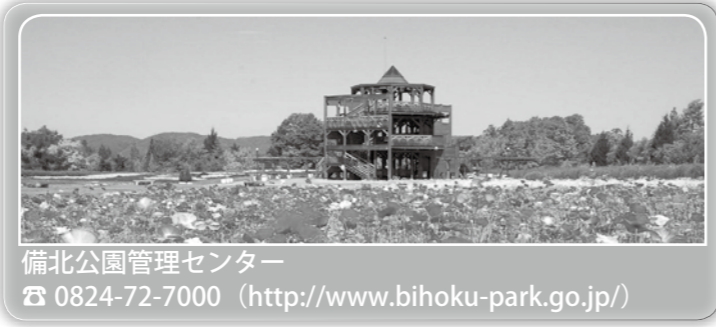
備北公園管理センター ☎0824-72-7000 (http://www.bihoku-park.go.jp/)

花の広場では春の花が咲き続けています。ピオラ、アイスランドポピー、などをご覧いただけます。また、湖畔ピクニック広場に広がる「ネモフィラの」「青いじゅうたん」が登場!淡いブルーの花が愛らしい、ネモフィラが丘いっぱい広がる花景色をお楽しみください。(第2駐車場から徒歩3分)