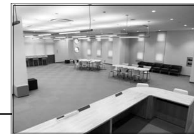
地元木材を使用した図書受付カウンター