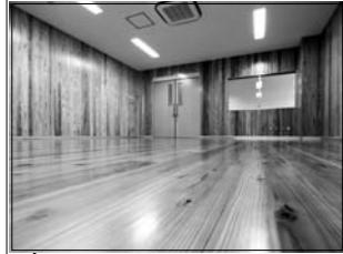
地元木材を使用した創作活動室