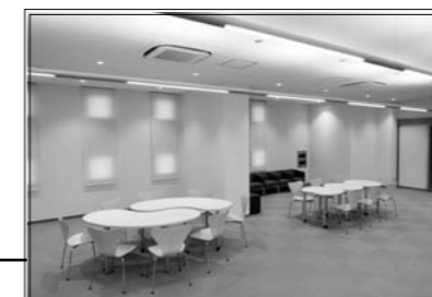
レイアウト自由な家具を配した閲覧コーナー