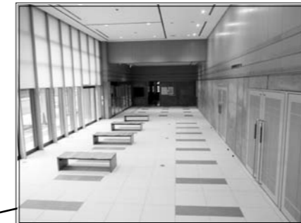
ゆったりした空間が広がる市民ロビー

統合された「東城自治振興区」が指定管理者として、図書館は市教育委員会が管理します。 今後は、複合施設の利点を生かし、東城地域に限らず多くの市民の利用が期待されます。