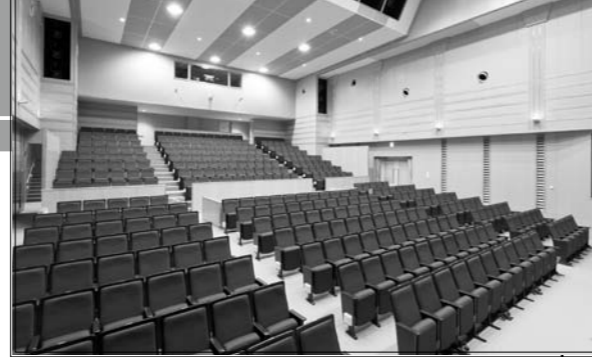
ユニバーサルデザインを取り入れた351人収容可能なホール