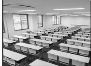
3分割でき100人収容可能な研修室