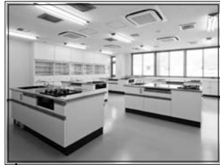
調理卓5台を備えた調理実習室