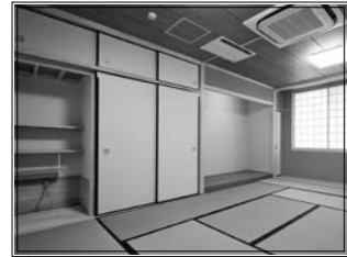
茶室設備も備えた12畳の和室