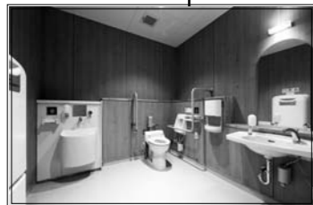
オストメイトなどを完備した多機能トイレ