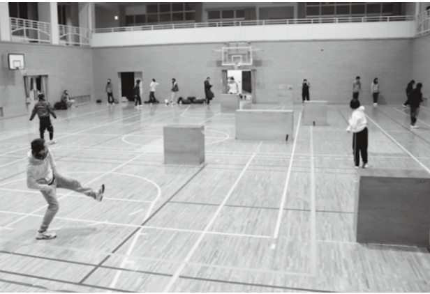
練習は素手でのキャッチボールから始まる

高野町出身。26歳。高校卒業後、市外の会社に7年間勤めた後、実家の和牛農家を継いだ。雪合戦チーム「雪村時代」キャプテン。昨年度行われた第3回日本雪合戦選手権大会ではチームを優勝に導き、同じ高野町のレディースチーム「雪娘」と共にアベック優勝を果たした。