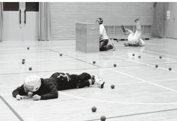
「あーっ！やられた！」生き生きと練習するチームメイト