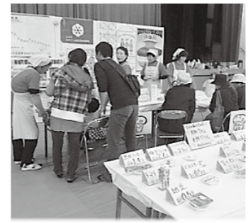
健康福祉まつりでの啓発