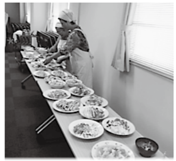
レシピ本掲載のための料理試作

市には、さまざまな健康づくりに取り組んでいる団体があります。その中で、「私たちの健康は私たちの手で」をスローガンに、食育アドバイザーとして地域における食生活改善の活動をされているのが食推の皆さんです。現在、東城・高野・総領地域にあり、ピンクのエプロンを着て頑張っておられます。 平成28年度の活動は、5月の健康福祉まつりで行った食推の活動の啓発に始まり、食育の日は店舗での高血圧予防のための減塩啓発、各地域の集会所などに出向いた生活習慣病予防の調理実習、親子の食育教室、生活習慣病予防に対応した簡単レシピ本の作成などを行いました。研修も積極的に行い、そこで学んだ知識を、さまざまな方法で地域に伝え、地域を元気にしています。 以前とは違い、今の活動は生活習慣病予防など、病気に対する活動が増えていますが、食推の活動において最も重要なことは「地域に伝える」ことです。食べることは「生きることの基本」と捉え、自分たちが学んだことを幅広い年代に伝え、地域全体で食を通じた健康づくりに取り組んでいけるよう日々活動しています。また、自分の健康づくりに役立ちます。 この活動に興味のある方はお問い合わせください。