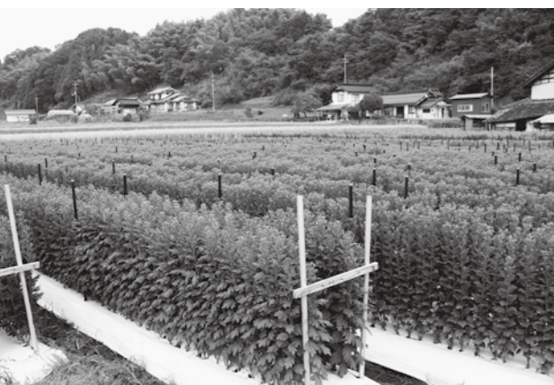
畑にはさまざまな品種のキクが育つ