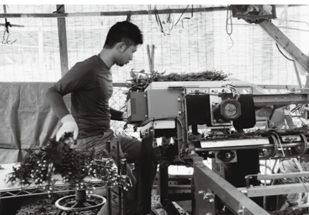
選花機を使いキクを重さごとに分けていく

西城町出身。22歳。庄原実業高等学校卒業後、滋賀県の園芸専門学校で学び、帰郷して家業のキク農家を継いだ。祖父母と父母、姉との6人暮らし。耕地面積はキク約90アール、米約75アール。