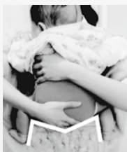
【図2】正面から抱く時は脚がM字になるように

運動発達について気になることがあれば、市役所保健医療課または医療機関へご相談ください。市では奇数月第4木曜日の午後、理学療法士が相談に応じます。予約が必要ですので、保健医療課健康推進係までお問い合わせください。