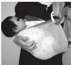
【図1】生後4カ月までのスリングでの横抱きは危険