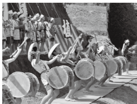
山内小学校の児童による田楽の発表

栽培・収穫した作物は、調理実習で食べたり、学校行事で地域の方に振る舞ったりします。また、収穫した米の販売も行っています。こうした地域の人々との交流も、食に関する関心・意欲の向上につながり、地域農業への理解を深めることに結びついています。