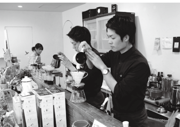
1杯ずつ丁寧にコーヒーを入れる