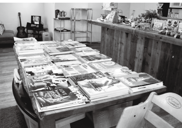
店内ではたくさんの雑誌や本を読むことができる