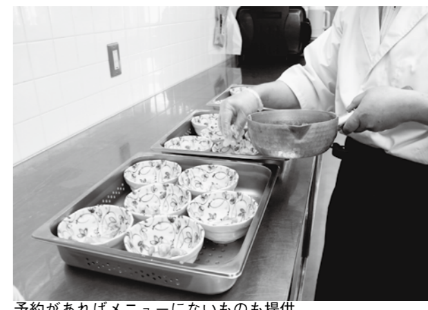
予約があればメニューにないものも提供