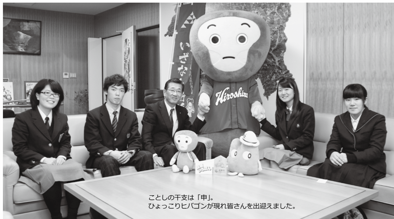
ことしの干支は「申」。 ひょっこりヒバゴンが現れ皆さんを出迎えました。

会へ出ても、いずれは庄原に 帰ってみたいという思いにも なってもらえるだろうし、帰っ て来てほしいと思います。そ のためにも懐かしさが残るま ち、安心、安全、心の豊かさ を感じられるまちづくりをし たいと思います。 昨年、道の駅たかのから東 城インターチェンジまでを結 ぶ道路を「比婆いざなみ街道」 と命名し、この沿線にある資 源に光を当て、磨くことで庄 原市の魅力を一体的に発信し ています。この中には神楽で あったり、祭であったり、皆さ んの心に残っているものも多 くあります。 交通の利便性というのは、 若い人だけでなく、お年寄り が買い物をする利便性を考え た交通体系も必要で、だれも が使いの利便が良いものに工夫 する必要があります。 エコの話も出ましたが、私 も都会へ出て帰ってきたとき に、風呂を炊く煙が煙突から 出ている光景を見て、子ども ながらに「ほんまに田舎は良 いのう」と感じていました。 今日いただいたご意見は今 後のまちづくりの参考にさせ ていただきます。