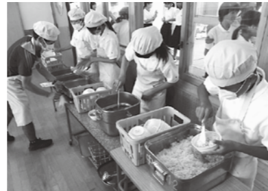
庄原中学校配食風景

子どもたちの日常生活の一部となっている学校給食は、栄養バランスのとれた豊かな食事を提供することはもとより、生産者などのご協力により得られる、新鮮でおいしい地元食材を生かした行事食や郷土食を献立に取り入れるなど、地域の農業や食文化を知ることができる場になります。