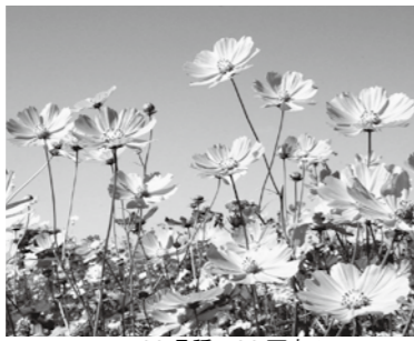
100品種・90万本のコスモス