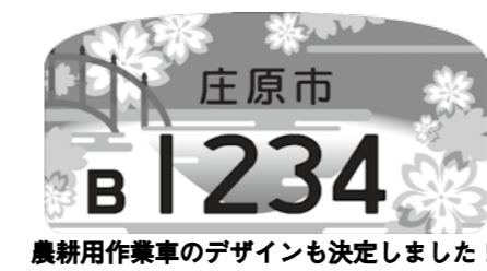
農耕用作業車のデザインも決定しました!

「買い物しすぎて支払いができない...」「携帯代が高く生活費が足りない...」「計画的にお金が使えない...」 こんなことはありませんか? 今回の当事者のつどいのテーマは「お金」です。悩みや困り事を出し合い、安心して就労、生活する手立てを考えましょう。気軽にご参加ください。 とき 10月19日(月) 13時30分 ところ 「ラウンジ笑花」 三次市十日市東5丁目13-10 対象 生きづらさを抱えている方とその家族・障害者の就労に携わっている支援者。 お茶代 100円 申し込み方法 電話・FAXでお申し込みください。 申し込み・問い合わせ 備北障害者就業・生活支援センター 0824・63・1896 FAX 0824・63・1897