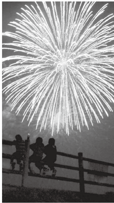
音楽と花火の祭典

備北公園管理センター ☎0824-72-7000 (http://www.bihoku-park.go.jp/)