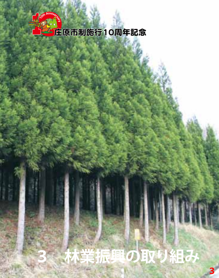
3 林業振興の取り組み

山の機能を取り戻す 森林には水をきれいにしたり、災害を防いだりする環境保全の機能と、スギやヒノキを中心とした木材生産の機能があります。 本市の森林面積は10万4千715haあり、広島県全体の森林面積の約17%を占めています。スギやヒノキの人工林が多く存在し、森林資源として利用できる木材が伐採時期を迎えています。