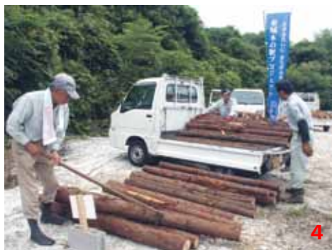
1_比婆牛素牛の初せりの様子 (H 26.7) / 2_比婆牛ブランドの和牛肉販売 (H 26.7 ~) / 3_ひろしまの森づくり事業で市内各地の森林整備が進む (H 19.5 ~) / 4_東城木の駅プロジェクトスタート (H 26.8 ~)

かつての比婆庄原地域は、日本最古の4大蔓牛のひとつ「岩倉蔓」をもとにした集団的・計画的な和牛改良が進められ、優秀な和牛の産地として広く知られていました。これらの和牛は「比婆牛」と呼ばれ、遠方から多くの畜産家が比婆牛を買い求めるために訪れていました。林業を取り巻く状況は依然として厳しいものがあります。こうした状況の中、森林資源をより効率的に供給する基盤づくりとして、広島県、市、森林組合が連携し、路網の整備や団地化による一体的な森林整備などを進めてきました。一方で、手入れの遅れている森林を整備するため、平成19年度から「ひろしまの森づくり事業」により、スギやヒノキの間伐、集落に隣接する里山林や竹林の手入れを実施。毎年約300haの森林が市内各地で整備されています。