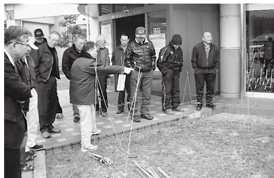
柵の設置方法を学ぶ