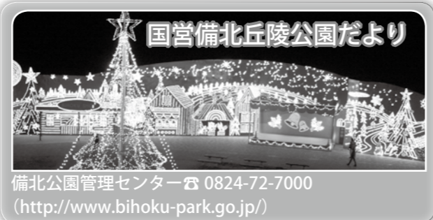
国営備北丘陵公園だより 備北公園管理センター ☎ 0824-72-7000 (http://www.bihoku-park.go.jp/)

※該当する方の情報は、情報政策課広報広聴係(☎082-4-73-1159)までお寄せください。