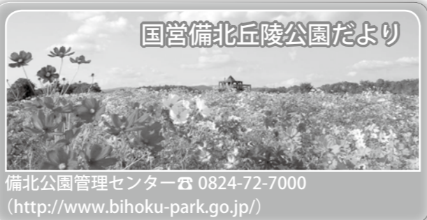
国営備北丘陵公園だより

備北公園管理センター ☎ 0824-72-7000 (http://www.bihoku-park.go.jp/)