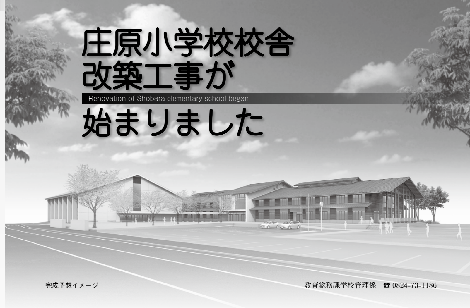
完成予想イメージ