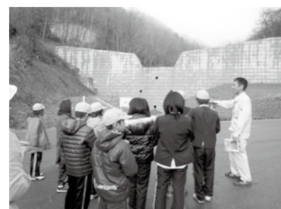
現地を見学する川北小の児童

(広島県土木局道路整備課課道グループ 主査) 当時、広島県北部建設事務所庄原支所 災害復旧チームの一員として従事