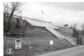
市内6カ所に設置された「三陸自動車道津波避難階段」