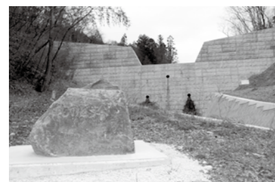
えん堤に設置された石碑には児童が書いた名前が刻まれています

これだけの被災があったということ、後世に伝えていかなければいけない、それをどうしたら伝えていけるのかを考えて発案したのが、地元の子どもたちによる石碑の設置でした。