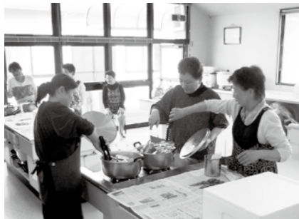
川手上自主防災本部による炊き出し訓練の様子

近年、全国各地で地震や台風、大雨による大きな災害が相次いでいます。本市でも4年前にゲリラ豪雨による災害が発生したように、災害はいつ、どこで起きるか予測することはできません。今まで災害がなかった地域でも、将来的に災害が発生しないという保証はまったくありません。 また、大きな災害が発生すると、行政だけの対応には限界があります。災害発生時に被害を最小限にするためには、自分の命を守る「自助」、みんなの地域はみんなを守る「共助」、行政が担う「公助」の3つが連携をし、バランスよく支え合うことが最も重要だと考えています。 そのためにも、日ごろから災害に対する備えを怠らず、いつでも対応できる用意をしておけば、被害の拡大を未然に防ぐことができます。 阪神・淡路大震災を機に、全国的に自主防災組織の結成が進んでいます。本市でも豪雨災害を機に自主防災組織をつくる動きが高まり、3月末時点で41組織が結成されていますが、組織率（組織団体の対象世帯／全世帯）としては47・2%とまだまだ低く、組織化に向けた取り組みをさらに進めていかなければならないと考えています。 市は、危機管理体制の強化を図るため、豪雨災害の翌年度から危機管理課を設置しました。豪雨災害の教訓を踏まえて緊急時の職員配備体制や、避難勧告の発令や伝達の基準などを災害時