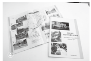
東松島市東日本大震災記録誌