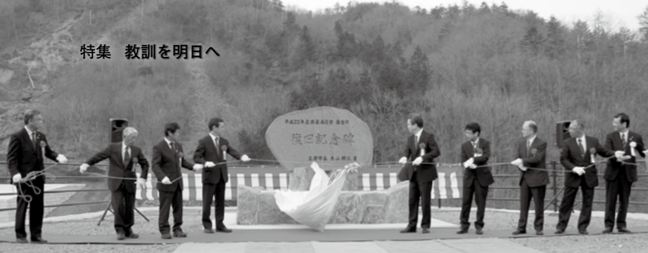
3月25日に行われた除幕式