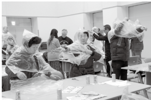
防災研修会では、ごみ袋を利用した雨がっぱ作りなどに取り組みました

このうち、今年1月に開催した防災研修会では、新聞紙を利用したスリッパやごみ袋を使った雨がっぱ作りの講習を行い、家族ぐるみで役立つ防災対策を学びました。