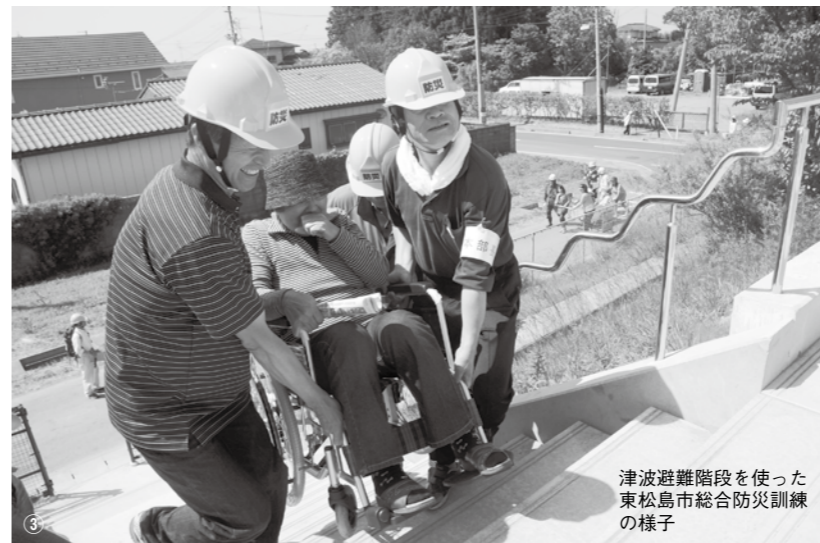
津波避難階段を使った東松島市総合防災訓練の様子