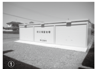
震災での教訓を生かした防災備蓄倉庫の「分散備蓄倉庫」