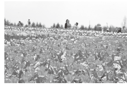
4月中旬からが見頃のチューリップ

今年の春まつりは「花遊はなあそび」をテーマに開催します 遊び心を取り入れたお花の装飾や、新しい写真スポットなど、子どもから大人の方まで楽しめます。また、4月12日(土)、13日(日)は上野池と公園をつなぎ、桜めぐりが楽しめる「桜めぐりシャトルバス」(無料)を運航します。