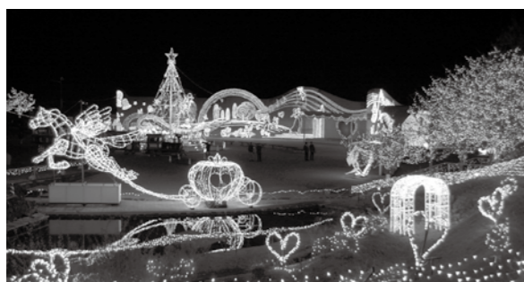
中入口 かぼちゃの馬車、ピックパネル

テーマ「 誓い 」 大切な家族と、友人と、恋人いろいろな愛のかたちを約束・誓うようなイメージとしています。