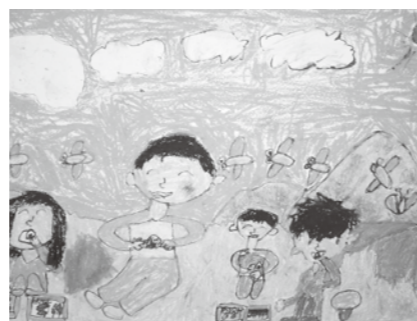
庄原市食育子ども絵画展(2013)市長賞 小谷 駿介くん(西城小1年)