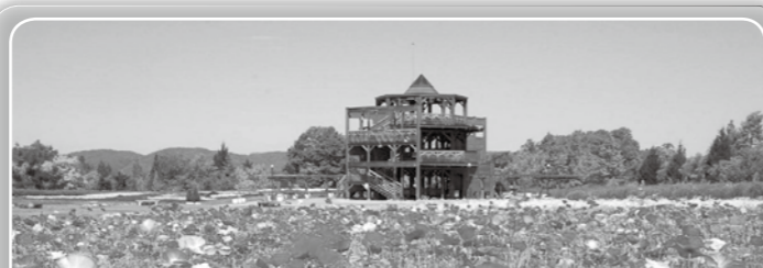
備北公園管理センター ☎ 0824-72-7000 ( http://www.bihoku-park.go.jp/ )