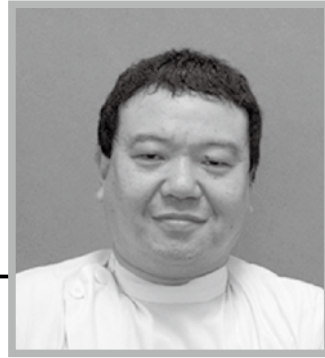
庄原赤十字病院 第二内科部長