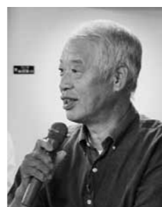
9月1日 / 庄原（東・山内）会場

Q 東城地域のごみの持ち込みにの対応について説明してほしい。 A 東城地域のごみの持ち込みについては、用地が決められないと建物建てられないが、候補地への説明などどのように考えているのか。 Q 施設整備のスケジュールについて、用地が決められた。このたびの用地選定については広く市民の意見を聞きながら11月中旬に絞り込みをしていきたいと考えている。 A 候補地については、新聞などで報道されたが、6月に市民の検討組織を立ち上げた。このたびの用地選定については広く市民の意見を聞きながら11月中旬に絞り込みをしていきたいと考えている。 Q 候補地の決定以降、丁寧な説明やお願いをしていくよう考えている。