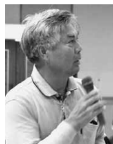
8月31日 / 口和会場

Q 経費の3000万円を差し引き、現時点では処理経費は3億1200万円のところ、2億6000万円程度まで削減され、可燃ごみ1トン当たり4万円かかっているものが、3万3000円程度になると試算をしている。 Q 備北クリーンセンターの処理能力が1日当たり40トンで東城クリーンセンターであれば、合わせて59トンの処理能力ということになる。今回新たに整備する施設の処理能力が1日当たり34トンということだが、処理しきれないのか。 A 国の補助金をもらうための要件として、ごみを削減するという大原則がある。現在、施設の稼働状況については最大量ではないが、現在よりもごみの減量に取り組んでいたかという点については、ごみが減少するまでの一定期間