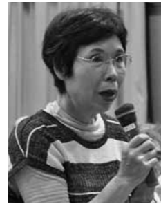
9月7日／庄原(高・本村・峰田・数信・北)会場

Q 緩和型サービスに従事できる介護サポーターになるためには、どのような研修を受けるのか。 A 介護職員初任者研修の力リキラムから基本的な内容を抜粋し、2日間学習する。その後、2日程度の現地実習を行うこととしている。