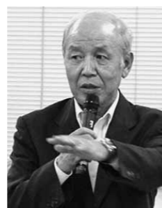
8月30日 / 東城会場

Q 東城地域のごみは固形燃料にして福山市にある発電会社を持って行くと説明があったが、その固形燃料についての売り上げのようなものはないのか。 A 東城地域のごみについては固形燃料にしているが、燃料を売っているというのではなく、ごみ処理をお願いしている。逆にごみの処理費用を拠出しているのだから、売り上げという形ではあがってこない。しかし、その会社は株式会社であり、利益があつた場合は、配当という形で還元はある。 Q 56億円かけて新しい施設を整備するのに、補助率はどれくらいで、市の負担がどれくらいになるのか。 A 56億円のうち、国の補助金が約16億円で、差し引き40億円が市の負担となる。 Q 新しい施設に集約することで、処理経費はどの程度縮減できるのか。 A 新しい処理施設の運営について不明の部分もあり、現段階で正確な説明はできないが、処理施設の位置を庄原地域に固定し、ごみの量を現状に当てはめて考えてみると、東城地域では可燃ごみの処理経費が年間9742万円がかかっており、そのうち8200万円がごみ処理施設の運転管理経費であり、まずその経費分が削減される。一方、東城地域から庄原地域までの運搬経費や、東城クリーンセンターをごみのストックヤードとして使用したときの