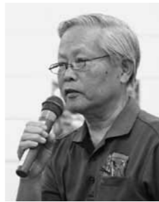
9月9日／庄原(庄原)会場

Q 利用者にとってのメリットはなにか教えてほしい。 A 緩和型サービスを利用する方は、サービス費用を少し抑えるので、利用者負担分もやや低くなる。 また、介護人材が不足する中では、今後必要なサービスが提供できなくなるおそれがあるが、緩和型サービスの導入により、専門職以外の方も介護人材として活躍できるので、サービスの維持が図られると考えている。