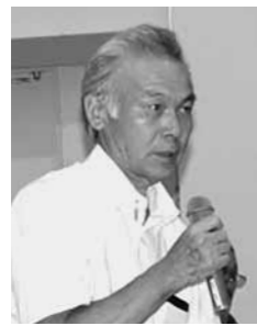
8月26日 / 総領会場

Q 三次市は随分前から衣類はリサイクルごみで収集していると思う。そうすれば可燃ごみが減ってくるのではないか。 A 東城地域では古着を回収してそれを民間の業者に処理をお願いしている。東城以外の地域も東城地域と同様に古着の分別回収をして処理し、併せてリサイクルについての検討も行っていく。 Q 指定ごみ袋が有料で、ごみ処理費の一部を負担している。理解しているが、その袋代などとして市民が直接負担しているのはどれくらいなのか。 A 直接ごみを搬入した際の手数料や、ごみ袋代を合わせたると、8500万円程度である。 Q 庄原市のごみの処理経費が他の市町に比べて大変高くなっているという説明だが、何が原因でそんなに高くなるのか。 A 経費が低い市町の傾向を見てみると、単独の市町で直接施設を持つのではなく、複数の市町で施設を運営し、広域的なメリットが出て