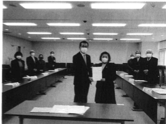
●農業者を代表し、現場の声を行政に伝えています!