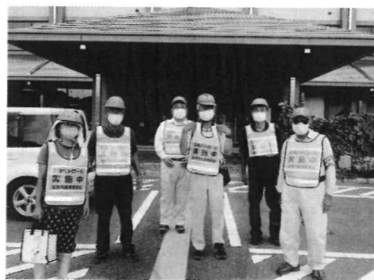
●地域の農業委員・推進委員で市内を農地パトロール!