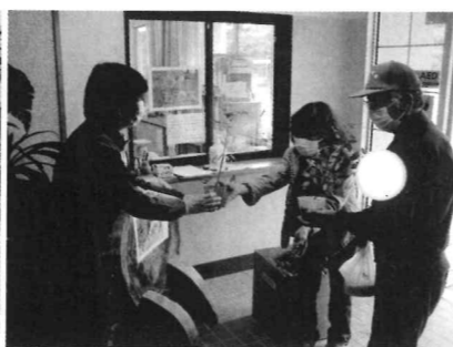
●毎年女性委員が主軸の活動を行っています!