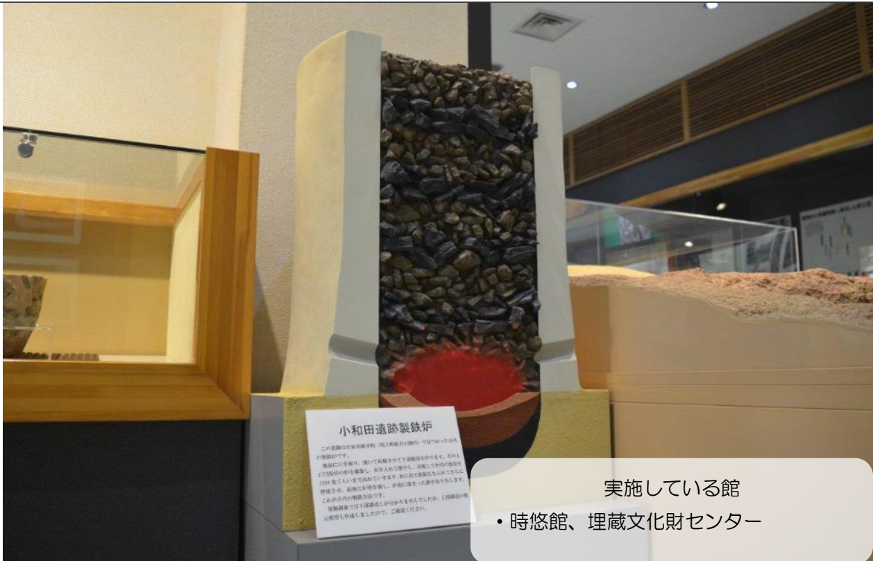
小和田遺跡製鉄炉 この遺跡は鉄製の製鉄炉（炉）の遺跡で、縄文時代の製鉄の痕跡です。 遺跡に穴を開き、炭いけを多量に投入して製鉄し、溶融して鉄の塊を 10分ほどおいて取り出します。この製鉄法は、鉄の塊を溶かして 鉄塊を造り、鉄塊に鉄塊を造り、鉄塊に鉄塊を造り、鉄塊に鉄塊を造ります。 この製鉄法の遺跡は、縄文時代の製鉄の痕跡です。 詳細は、この遺跡の解説書をご覧ください。