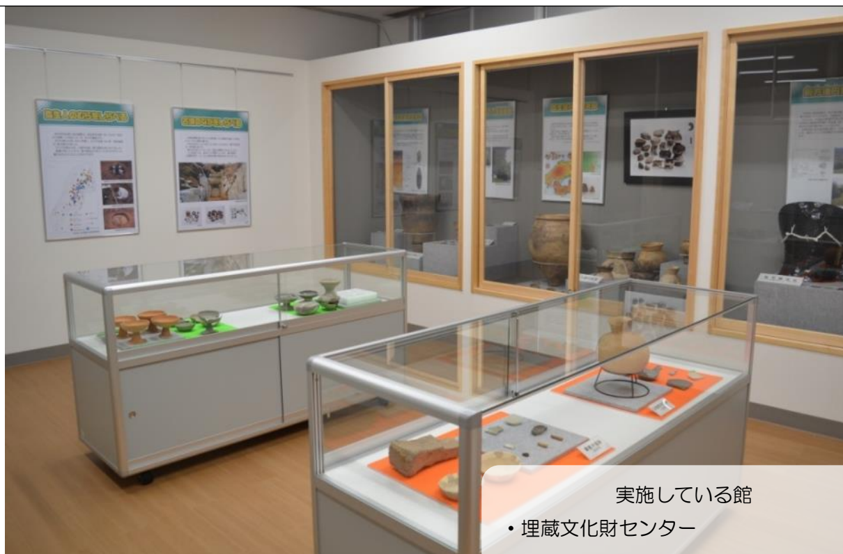
実施している館 ・埋蔵文化財センター

平成 30 年度にオープンした「庄原市埋蔵文化財センター」は、市内の埋蔵文化財を一同に集めて保管している施設です。