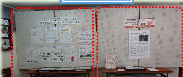
ソバに関する学習の展示 【中学校総合的な学習の時間】