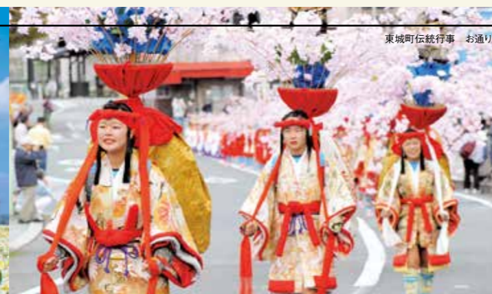
東城町伝統行事 お通り