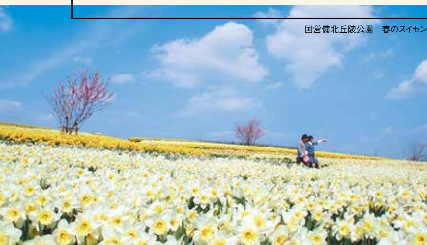
国営備北丘陵公園 春のスイセン