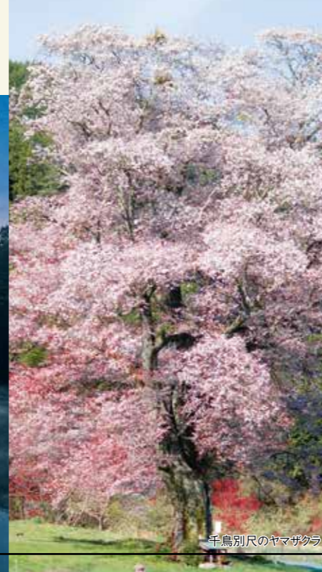
千鳥別尺のヤマザクラ