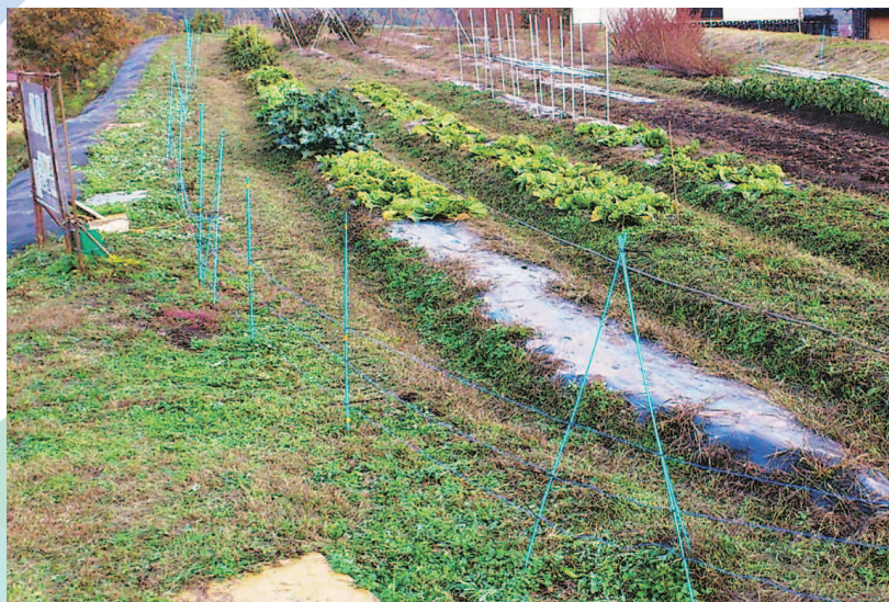
何も植えないゾーン