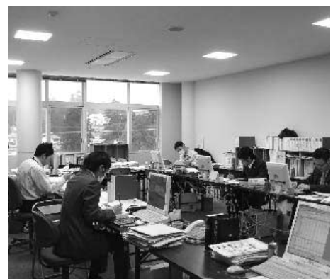
22年度予算編成（財政課）

答 国の農業関係予算の概要は、戸別所得補償制度の導入及び農山漁村の独自産業化へ向けた予算が新設要求された一方、既存の事業予算は、事業の整理統合や対前年4〜15%の削減となっており、農林水産省関係予算総額では、対前年94%の予算要求となっている。本市の22年度の農業関係予算は、現在取りまとめを行っているが、国県事業の動向が定まらない現状においては、単市事業での支援策も含め、本市農林畜産業の振興発展と農地の保全等を推進する観点からも、基本的には今年度同様の制度内容で当面の予算措置に取り組んでいきたい。