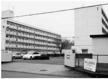
雇用促進住宅（戸郷町）

答 ①庄原団地が昭和55年の建築で、2棟80戸の3DKと2DKが各1棟40戸、入居戸数は41戸。東城団地は昭和52年の建築で、2棟80戸、間取りは2DKのみで入居戸数は49戸。宮平団地は平成5年の建築で、2棟60戸の3DKのみで入居戸数は34戸。