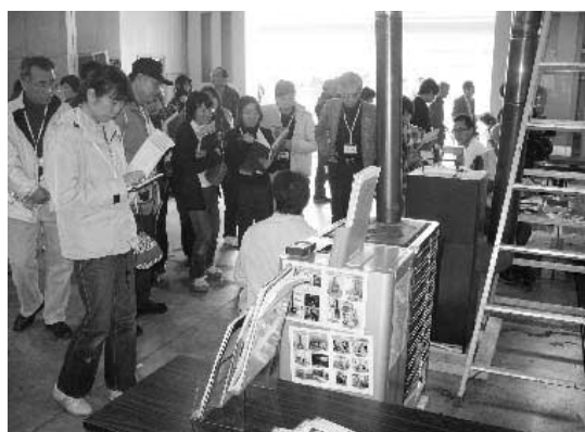
バイオマスフォーラムでのペレットストーブ展示即売会

18年度に策定した長期総合計画は、建設計画の趣旨、理念を尊重し、げんきとやすらぎのさとやま文化都市と人と地域が輝く美しい日本のふるさとを将来像としている。この長期総合計画の将来像を実現するため、実施計画を策定し、着実に事業を実施してきた。これまでに後期実施計画の方針で示しているとおり、特定と通常の事業区分により、全域的、一体的な発展の視点をもって事業を推進することとしている。この後期実施計画を基本として、22年度予算を編成していく。厳しい財政運営や景気低迷、先の見え