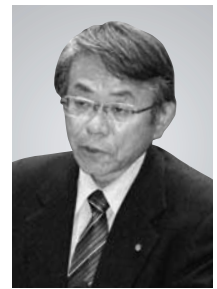
たかくち たかあき 議員 谷口 隆明