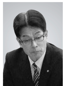
とくなが ひろあき 議員 徳永 泰臣

問 グリーン・ツーリズムは、都市住民が農山村の農家、民宿等に滞在し、自然の中で地域の人と農林業や伝統文化等に参加して余暇を楽しむことだが、都会の小・中・高校を対象に修学旅行を誘致し、受け入れることにより、地域に与える経済効果は計り知れないし、農家にとっても大切な外貨になると思う。本市の地域再生事業の一つとして、グリーン・ツーリズムを推進したらと思うが、見解を伺う。