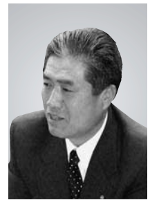
たなか ころう 議員 田中 五郎