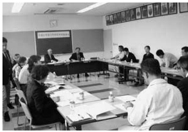
口和地区地域審議会

い市長率 パブリッ クコメン ト、今年 度から新 たに始め た自治振 興区活性 化会議な ど多様な