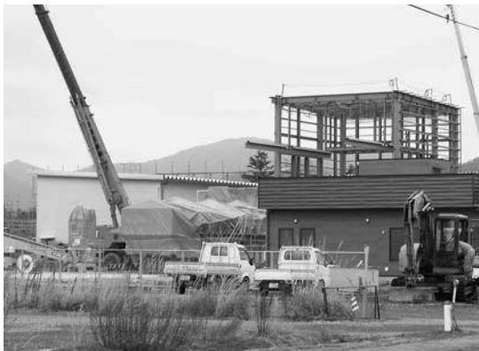
民間企業が工業団地に建設中の木質バイオマス利用プラント

中国自動車道、中国横断自動車道路尾道松江線などの交通アクセス、本市ならではの地の利や、県立広島大学、農林業支援、蓄積しつつある木質バイオマス関連業種等を本市の強みとしてPRし、粘り強く誘致活動を展開すれば、進出を希望する企業はあると確信している。誘致活動の中で、重要な局面や段階では、トップセールスマンとしてみずから動くことも必要と考えている。