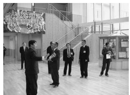
東通中学校（校舎玄関ホール）