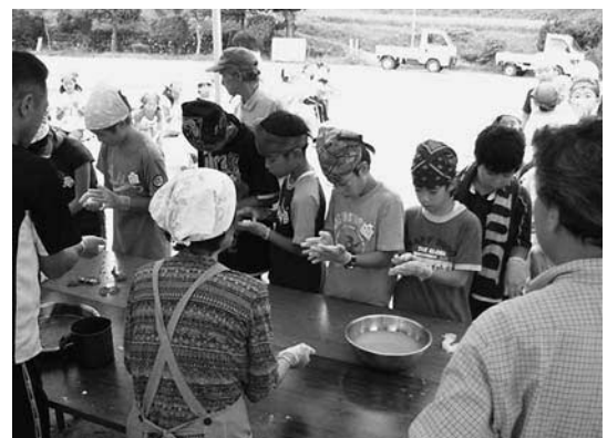
子どもふるさと交流（三河内地域）

答 最近農村地域の活性化策として、都市住民が農山村に滞在し、自然の中で地域の人とともに農林業や伝統文化、地域の産業等に触れ、余暇を楽しむグリーン・ツーリズムに関心が寄せられている。本市においても、旅行者や都会の学校から農村の生活や農林業体験を希望する問い合わせが増えてきている。修学旅行等の誘致の実現は大変喜ば