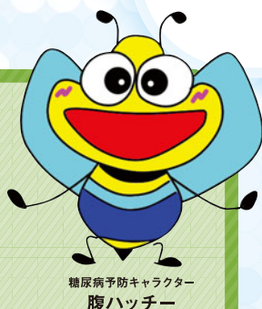
糖尿病予防キャラクター 腹ハッチー