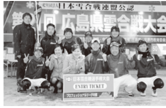
広島県大会の優勝チーム(Pリーグ及びレディースの部)は、日本雪合戦選手権大会(長野県白馬村)へ！