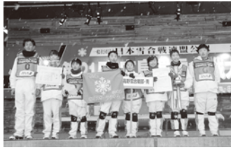
昨年度のジュニア優勝チーム

雪合戦は「ヘッドワーク」「フットワーク」「チームワーク」を駆使して戦う、新しい冬の団体スポーツです。日本雪合戦連盟の公式ルールに則り、相手の選手めがけて雪玉を投げたり、チームフラッグを奪い合ったり、ドキドキ・ワクワクの熱い戦いが楽しめます。