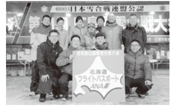
Pリーグ準優勝チームは、昭和山国際雪合戦大会(北海道壮瞥町)へ！